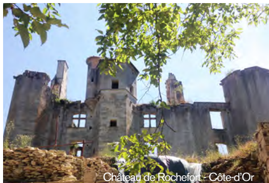
Château de Rochefort - Côte-d'Or