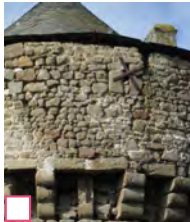
Château de Lassay