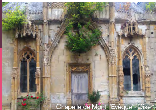
Chapelle de Mont-l'Évêque - Oise