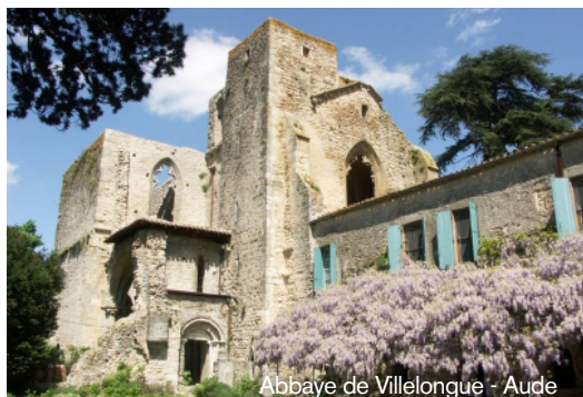
Abbaye de Villelongue - Aude

Soutenez ces projets du 19 septembre au 13 novembre 2015 sur fr.ulule.com/vmf ou en nous renvoyant ce bulletin de soutien.