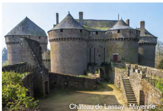
Château de Lassay - Mayenne