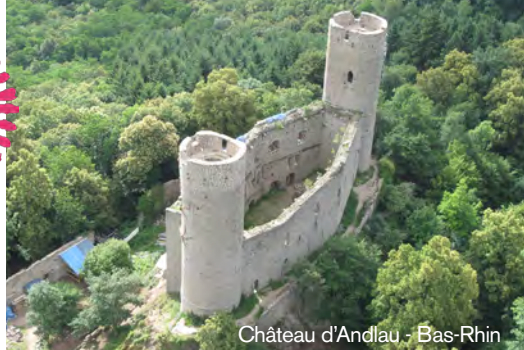
Château d'Andlau - Bas-Rhin

Notre engagement : pour chaque euro récolté, un euro versé par la Fondation VMF.