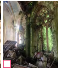
Chapelle de Mont-Évêque